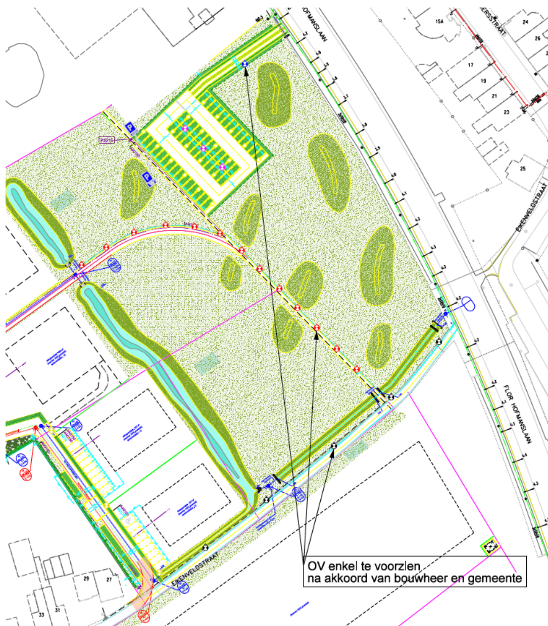
Figuur 1. Extra verlichting te voorzien in project verkaveling Lange Molenstraat/Eikenveldstraat. Het betreft verlichting in het park (rode armaturen), verlichting op het gedeelte Eikenveldstraat richting Flor Hofmanslaan (zwart armatuur) en verlichting aan de oprit van de parking (blauw armatuur).

De totale kostprijs van deze extra verlichting komt op 33.099,57 euro incl. btw (zie ook offerte in bijlage). De ontwikkelaar wenst deze kosten niet op zich te nemen omdat dit beslist is nadat de omgevingsvergunning verleend werd.