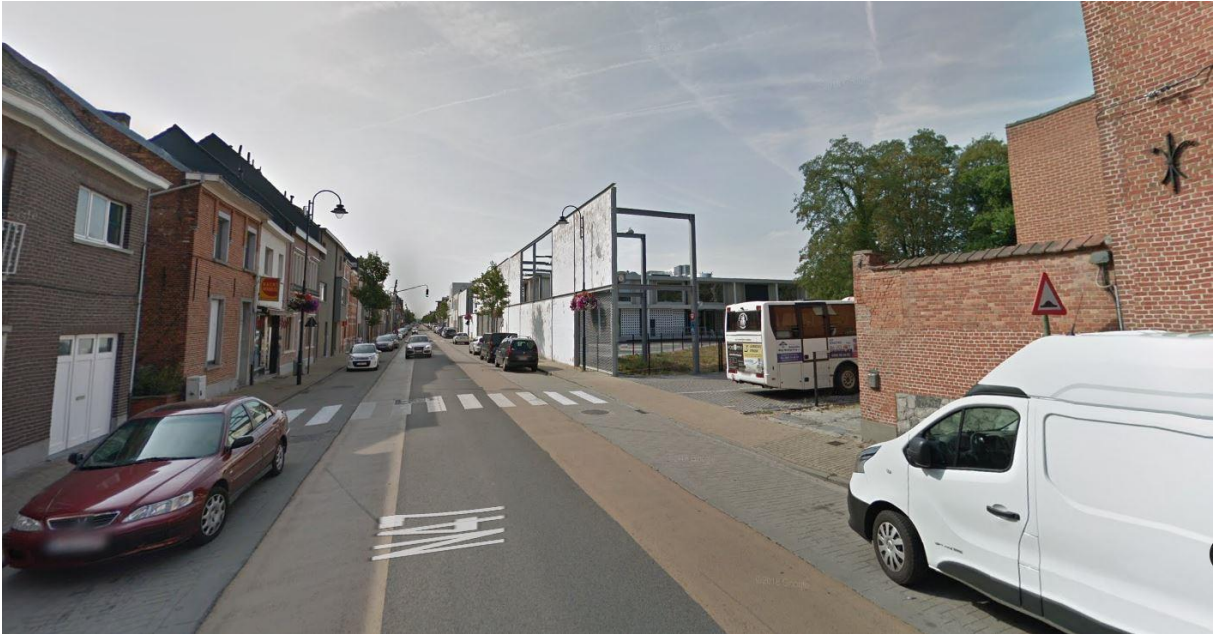
Zebraapad Brusselssteenweg t.h.v. parking en P+R zone school.

Dit zebraapad geeft langs de andere zijde uit op een trage weg die leidt naar de Laurierstraat. Het verplaatsen van dit zebraapad zal waarschijnlijk voor enige commotie zorgen, maar dit is momenteel nu eenmaal geen veilige situatie. Bovendien hebben de wandelaars de mogelijkheid om ofwel te wandelen naar het zebraapad aan de verkeerslichten met de Leo Duboisstraat of naar die aan de ingang aan de school. Deze zijn door de aanwezige verkeerslichten ook veiliger om over te steken. Bovendien wordt het oversteken op het zebraapad aan de ingang van de school 's ochtends vaak bijgestaan door een politieagent(e).