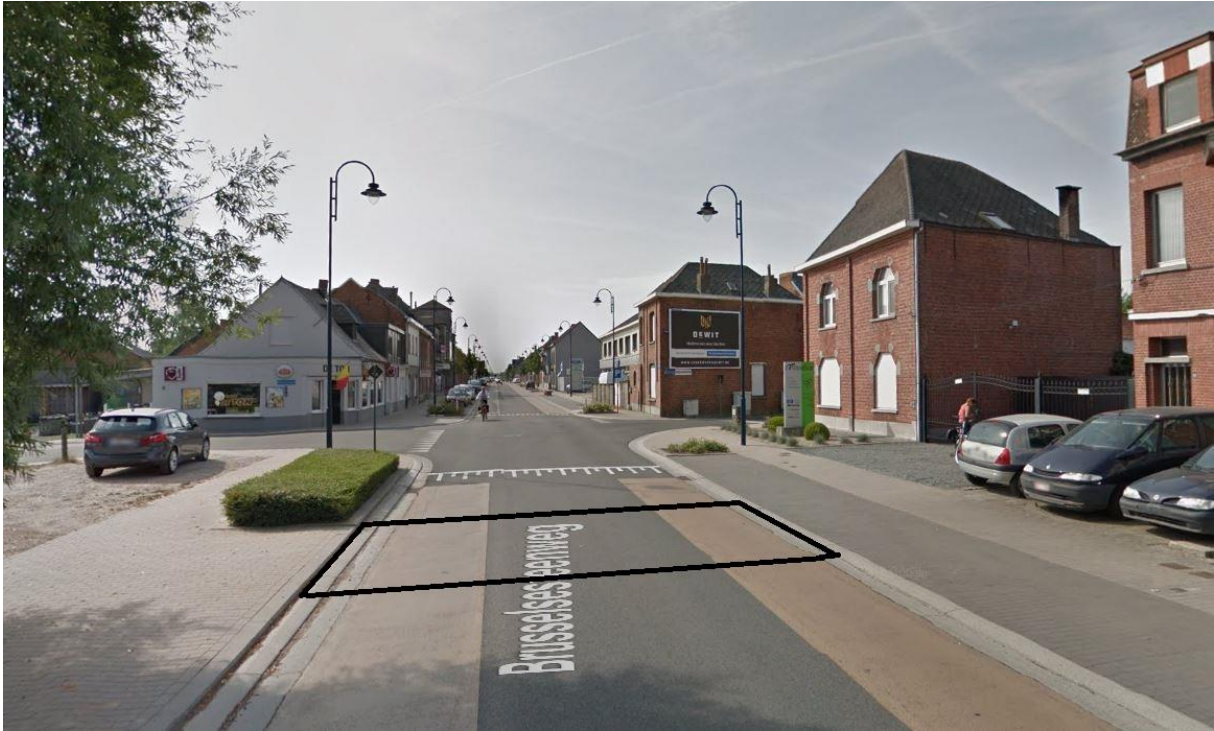
Vraag nieuw zebraad Brusselsesteenweg (t.h.v. Korte Varentstraat).

Het schepencollege gaat principieel akkoord met het verplaatsen van het zebraad aan de parking met P+R zone van VBS Lebbeke op de Brusselsesteenweg naar Brusselsesteenweg t.h.v. nr. 109 mits dit eerst nog wordt besproken met de directies van de Vrije Basisschool en de gemeenteschool. De verplaatsing dient tevens te worden afgetoetst aan het project Route2School.