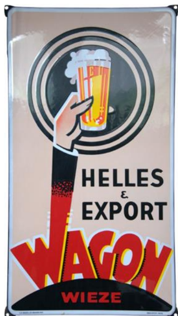
Reclamebord van de Brouwerij Wagon met vermelding van het “Helles” bier.