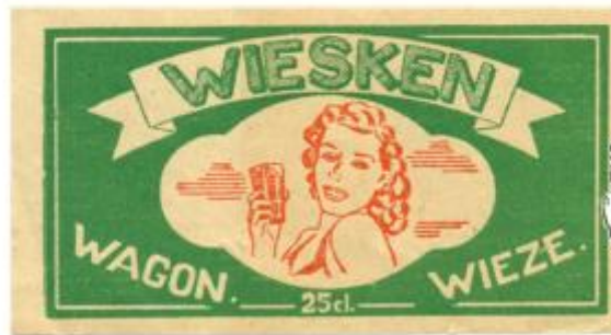
Bieretiketten van “Wiesken”

De verwijzing naar een biersoort is tevens een referentie naar de gewezen brouwerijverheid in Wieze. Bovendien zit in de naamkeuze “Wiesken” eveneens een indirecte verwijzing naar de naam van het bierdorp dat Wieze was.