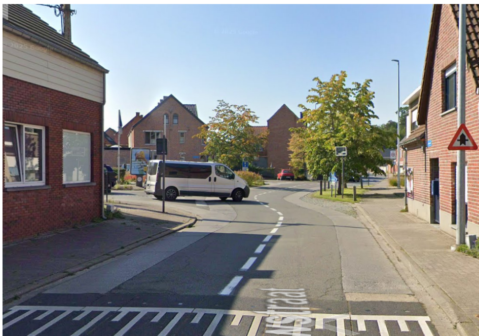
Foto 1. Huidige situatie Streekbaan. De betonnen fietspaden zijn verzakt.